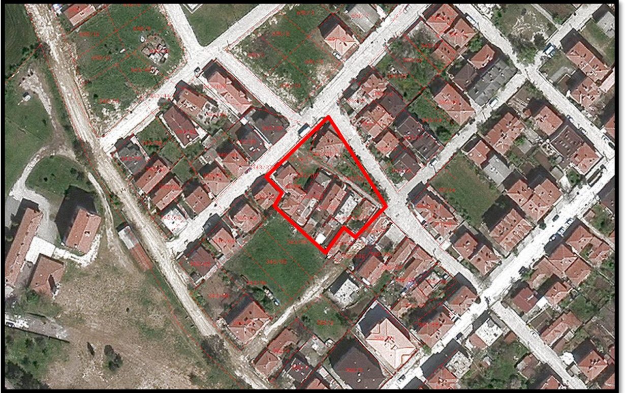
Resim 1: Planlama Alanının Yeri

Planlama alanı Tekirdağ İli, Saray İlçesi, Kemalpaşa Mahallesi, Karakovalık Mevkii, F19B09A1B ve F19B09A1C pafta, 343 ada 22 ve 23 numaralı parseller (343 ada 113 parsel) ile civarıdır.